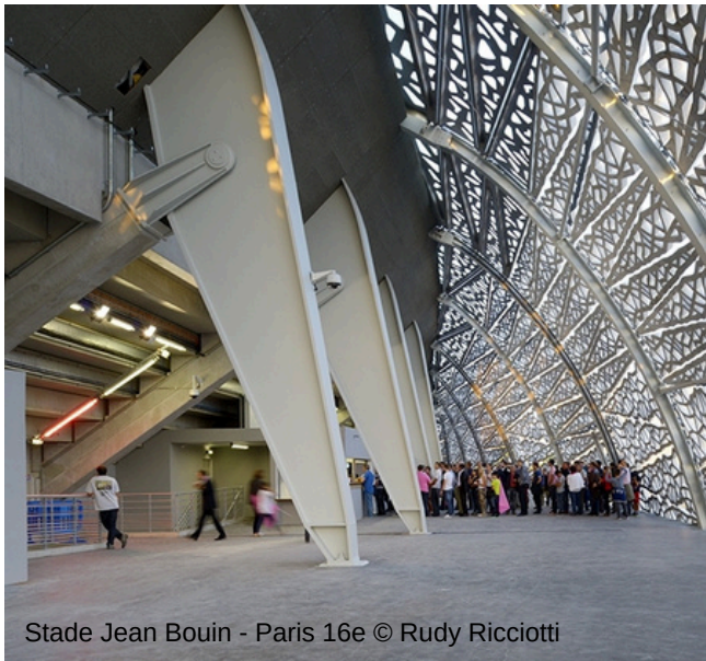
Stade Jean Bouin - Paris 16e © Rudy Ricciotti

Entièrement fabriqués en France, au sein de leur usine historique de Châtillon-sur-Saône, dans les Vosges, les luminaires Sammode se caractérisent principalement par leur design, leur qualité, leur innovation technologique et leur durabilité. En effet, le fabricant, presque centenaire, conçoit l'ensemble de ses produits dans le but de garantir une longévité extrême grâce à une conception basée sur l'emploi de matériaux robustes permettant la réparabilité, l'évolution technologique au fil du temps et la facilité de recyclage en fin de vie.